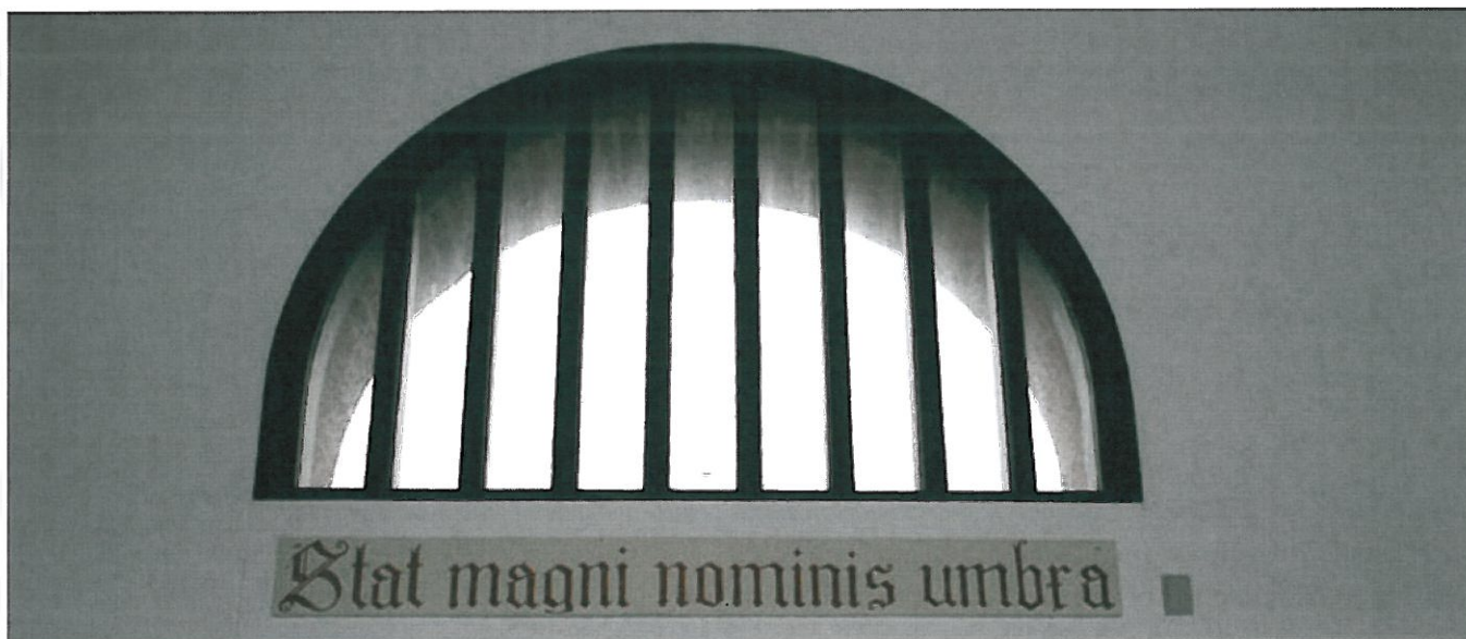
Hovedindgangen set inde fra forhallen. "Den (skolen) står i det store navns skygge."